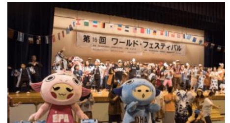
ワールドフェスティバル in 石狩

また、HIECCが開催している「世界の料理教室」について引き続き支援を行うとともに、海外からの研修生等と地域住民との交流活動を行っている独立行政法人国際協力機構（JICA）との連携を図る。