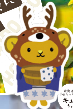
北海道観光 PRキャラクター キュン ちゃん