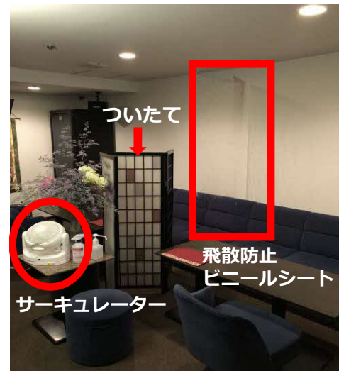
(専門家からの改善案のイメージ図)