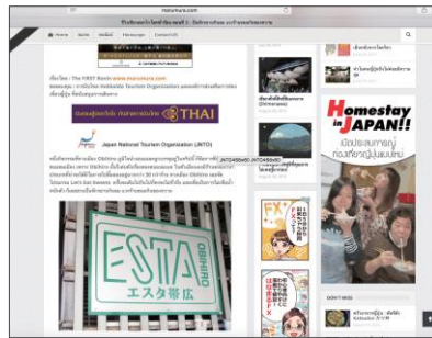
MARUMURA x ブLOGGER「パンゴ」と行く夏の北海道