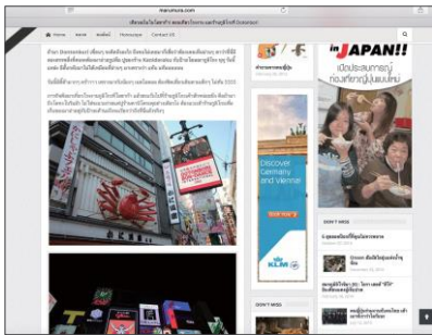
MARUMURA x ピムター in 大阪

JNTO との連携も多い訪日旅行ナンバーワンサイト「MARUMURA」では 日本の様々な自治体とのタイアップがあります