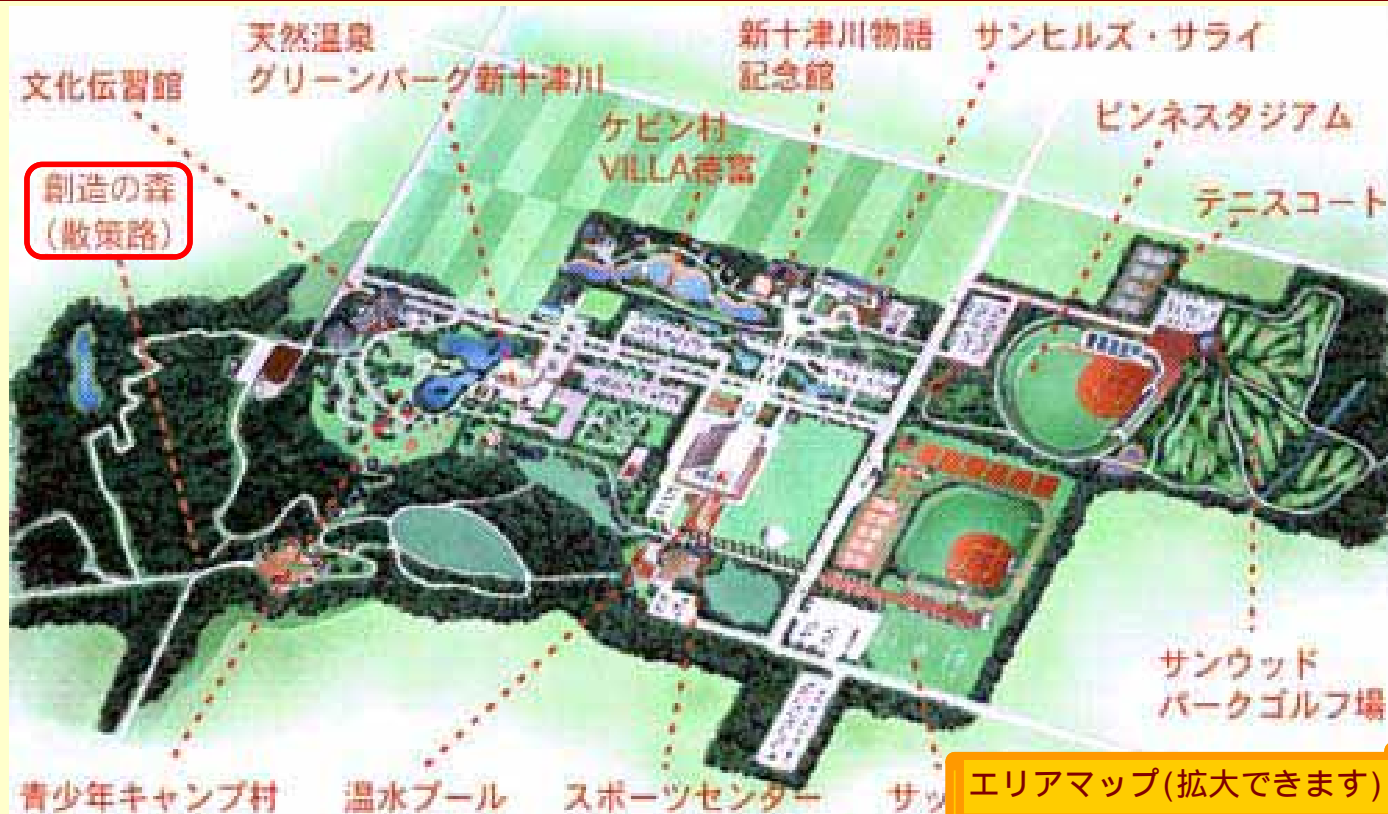
エリアマップ(拡大できます)