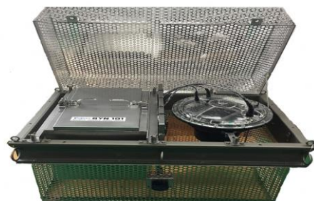
超音波照射装置（環境省請負業務）