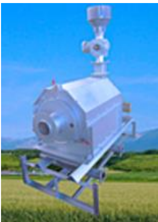
小型バイオマス燃焼機