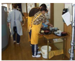
旭川技専介護アシスト科（施設実習）