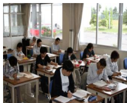
総合ビジネス科（簿記及び会計実習）