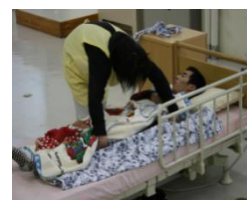
総合実務科（介護コース実習）