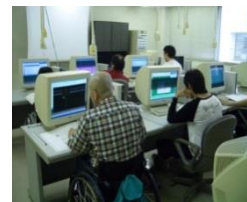
建築デザイン科（建築設計実習）