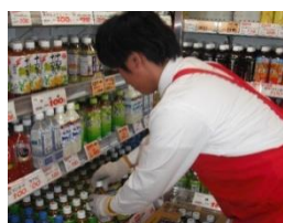
函館技専販売実務科（職場実習）