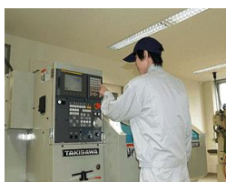
CAD機械科（設計製作実習）