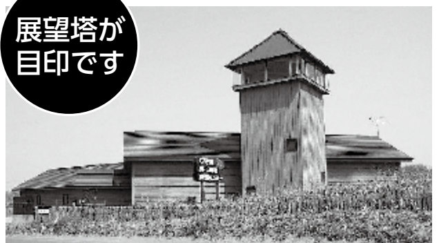
石狩浜海水浴場植物保護センター