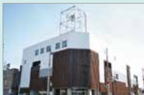
空きビル再生事業