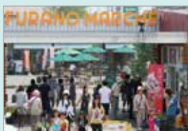
中心市街地のにぎわい滞留拠点