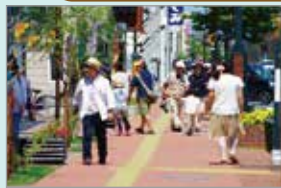
空き地・未利用地の解消