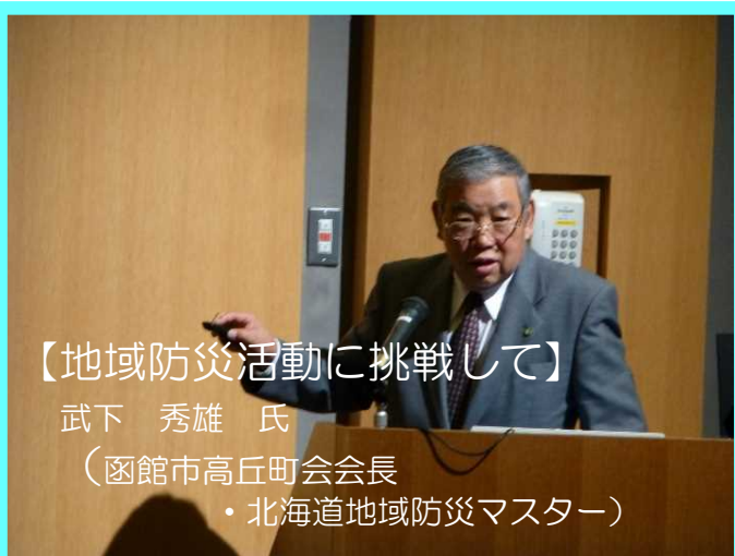
【地域防災活動に挑戦して】