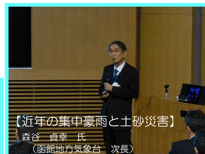
【近年の集中豪雨と土砂災害】