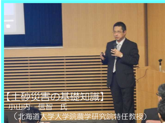
【土砂災害の基礎知識】

本講演会を通じて住民の皆様が土砂災害警戒区域等の指定の重要性とともに、地域防災力を高め、「土砂災害から自分の身を守る」ことについて考えるよい契機となりましたら幸いです。