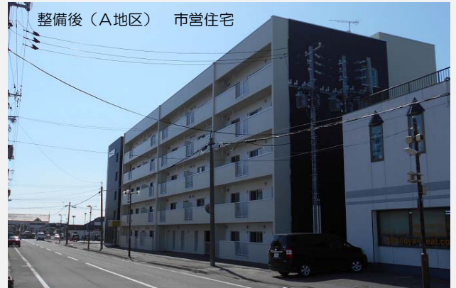
整備後（A地区） 市営住宅