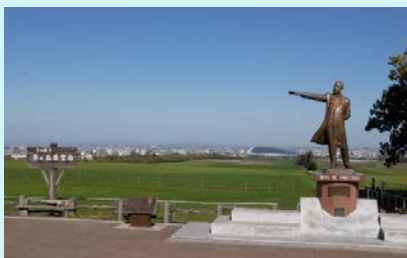
周辺の観光施設【羊ヶ丘展望台】