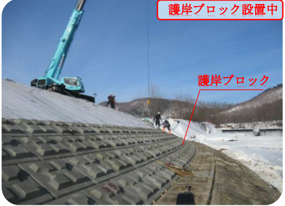
護岸ブロック設置中