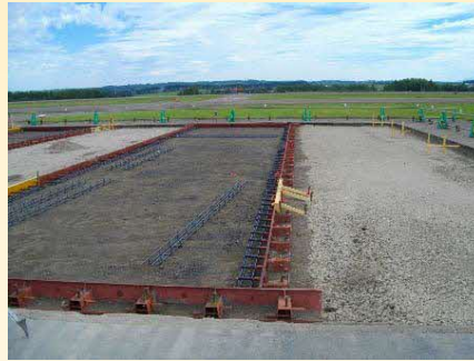
R1年度工事 施工状況