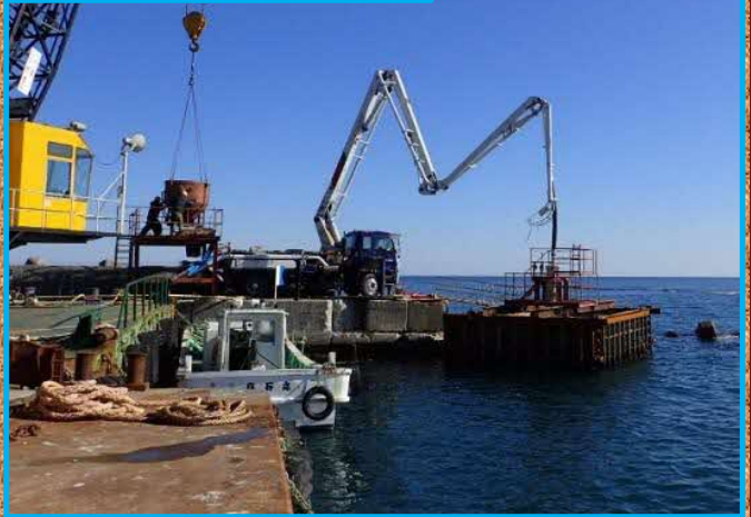
施工状況(コンクリート打設)