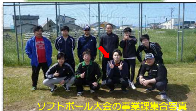
ソフトボール大会の事業課集合写真