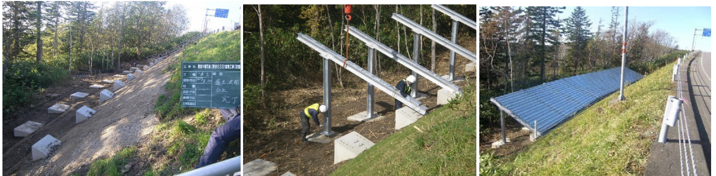
防雪柵(吹上防止柵) 施工状況

当該路線は豊富町と中頓別町を結ぶ路線であり、バス路線や生乳の搬送ルートにも利用され、峠部には道北地域をカバーする放送等の中継施設が多数ある等、地域にとって重要な幹線道路ですが、冬期間は吹雪による通行止めが度々発生するなどの課題があることから、防雪柵の設置により安全・安心な道路交通の確保を事業の目的としています。