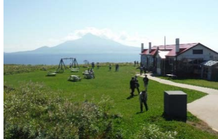
北のカナリアパークから望む利尻島

レブンアツモリソウ、「種の保存法」に基づく特定国内希少野生動植物種に指定されている花です。