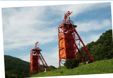
炭鉱メモリアル森林公園の旧三菱美唄炭鉱の立坑やぐら

空知地域には、「日本遺産」、「近代化産業遺産」や「北海道遺産」に認定された有形・無形の炭鉱遺産「炭鉱(やま)の記憶」や地域固有の景観が存在し、アートやジオパークなど、テーマ性のあるイベントや、炭鉱遺産をめぐるツアーの実施など、地域資源を活用した取組を進めています。また、炭鉱で働く労働者の重労働を支えた食文化がルーツとなった「やきとり」や「なんこ」などの炭鉱グルメなど、食の魅力発信も行っています。