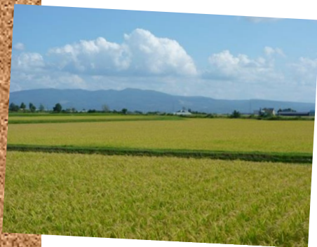
雄大に広がる田んぼに実るお米

空知は「ゆめぴりか」や「ななつぼし」などお米の生産量、作付面積がともに全道の約半数を占める全国有数の米どころで、そのほかにも小麦・大豆などの畑作や、野菜、園芸など多種多様な農業が行われています。