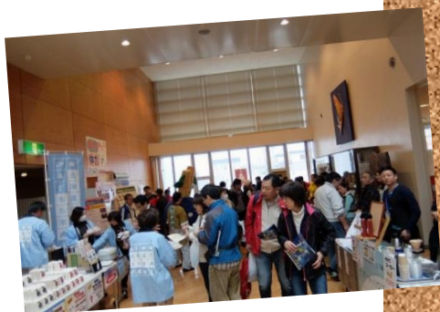
「よりみちの駅」 展示・販売の様子

「管内の情報発信基地」として、管内の農水産物や地元食材を使って製造された産品を集め展示・販売するとともに地域に関わる様々なイベント『よりみちの駅フェスタ』や『よりみちの駅★クリスマス』を実施するなどし、親しみやすく発信力のある庁舎づくりを目指しています。