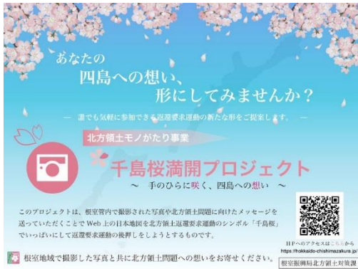
千島桜満開プロジェクト

北方領土問題を「知る」きっかけ作りとして、インターネットにより気軽に運動に参加できる「千島桜満開プロジェクト」ホームページを平成30年11月から開設しています。このホームページにアクセスし、根室管内で撮影した写真や北方領土問題に向けたメッセージを投稿すると、北方領土返還要求運動のシンボルの花「千島桜」がホームページ上の日本地図に一輪咲く仕組みとなっています。日本を「千島桜」でいっぱいにして、返還要求運動の後押しするとともに、投稿写真を通じて根室管内の魅力を発信しています。