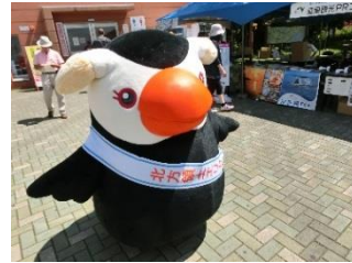
根室管内の魅力をPR