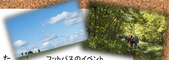
フットパスのイベント

世界遺産知床、ラムサール条約登録湿地をはじめとした素晴らしい根室管内の自然や生産乳量日本一、鮭・サンマなどの豊富な海の幸といった背景から作られるおいしい食などの情報を発信し、1人でも多くの方に観光に来て頂き、根室の魅力を知ってもらうよう取り組んでいます。また、地域一体となった観光プロモーションやフットパスのイベントなどを通じて地域の連携を進める取組も実施しています。