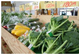
直売所の店内の様子