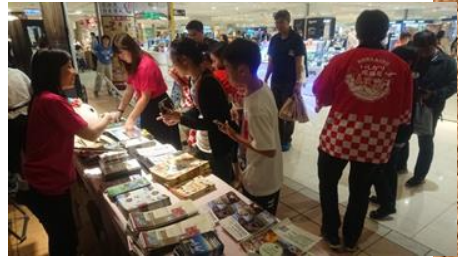
台湾での観光プロモーション (大葉高島屋)

石狩振興局管内は国際観光都市札幌や新千歳空港を有しながら、国立公園や田園地帯が広がる、都市と豊かな自然が共存する特徴的な地域です。管内には年間約2,800万人の観光客が訪れ、アジアを中心とした外国人観光客も増加しています。振興局ではSNSによる情報発信や現地プロモーション等を通じて、国内外に当管内が持つ「都市と自然との共存」「豊富な食・観光資源」など魅力溢れる地域特性をPRし、観光客や交流人口の拡大を図っています。