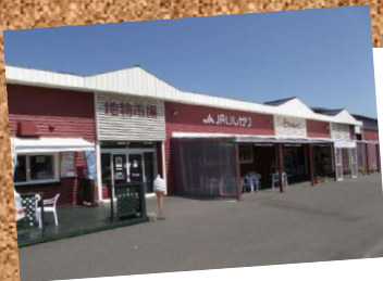
直売所(石狩市)「とれのさと」