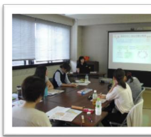
▲事例検討会の様子

転勤は、様々な出会いと自分を成長させるきっかけ になると聞いて、メリットがわかりました。