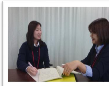
▲プリセプターとの面談