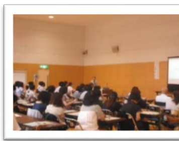
▲思春期保健研修会の様子