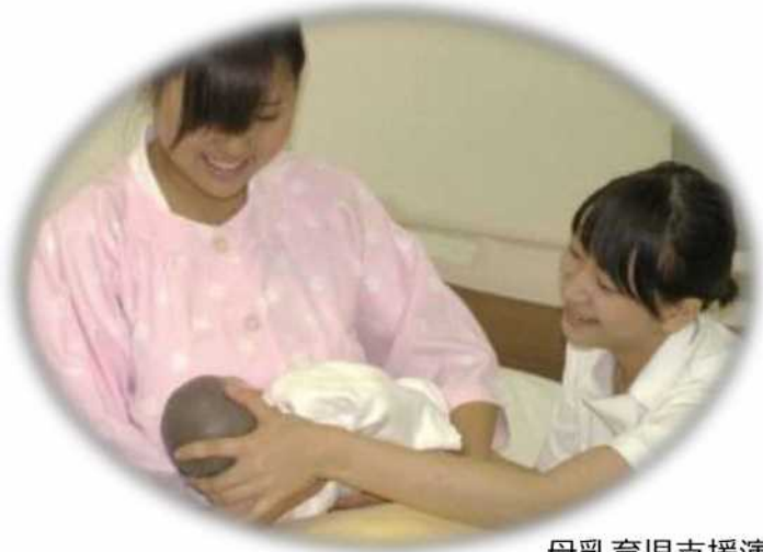
母乳育児支援演習