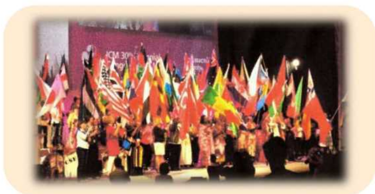
世界助産師連盟（ICM）第30回プラハ大会：2014