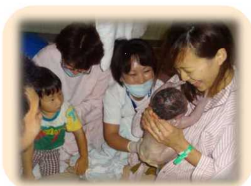
家族と共に迎えるいのちの誕生