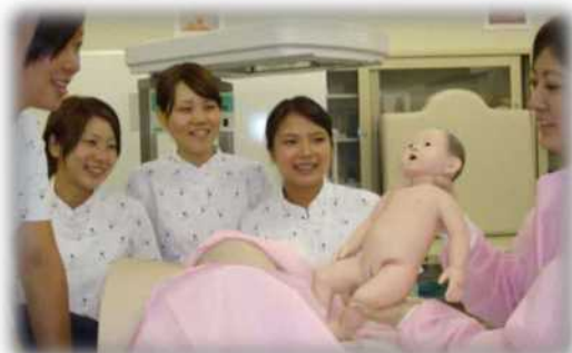
分娩介助技術演習

全国の助産師教育機関である正会員校一覧は、全国助産師教育協議会のホームページで見ることができます。