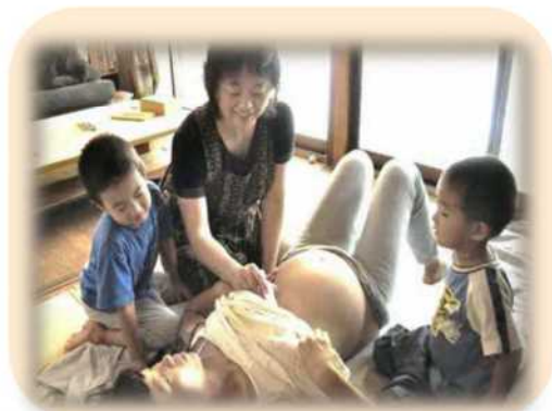
家庭訪問による妊婦健診