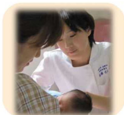
病院での母乳育児支援

私たちは自律して妊娠中の女性や妊産婦の診察をし、出産の介助をします。また、病院で働くことも、自分で「助産所」を開設（開業）することもできます。現在、全国に約3万人の助産師がいます。