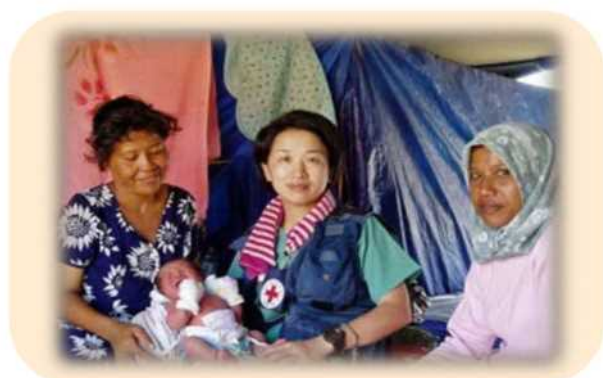
海外で活動する助産師

助産師とは英語でMidwife = with womanといい「女性とともに在る」という意味です。今でも妊娠や出産が原因で亡くなる女性がいます。女性や家族が安心して新しい命を迎えられるために、高い能力を備えた助産師の活躍は世界中で期待されています。日本で資格をとってから、海外で活動する助産師も多くいます。WHO（世界保健機構）やJICA（独立行政法人国際協力機構）といった国際機関ではたらく助産師もいます。世界中で活躍できる知識・技術・人間性など助産師としての基本は、助産師教育機関で学びます。