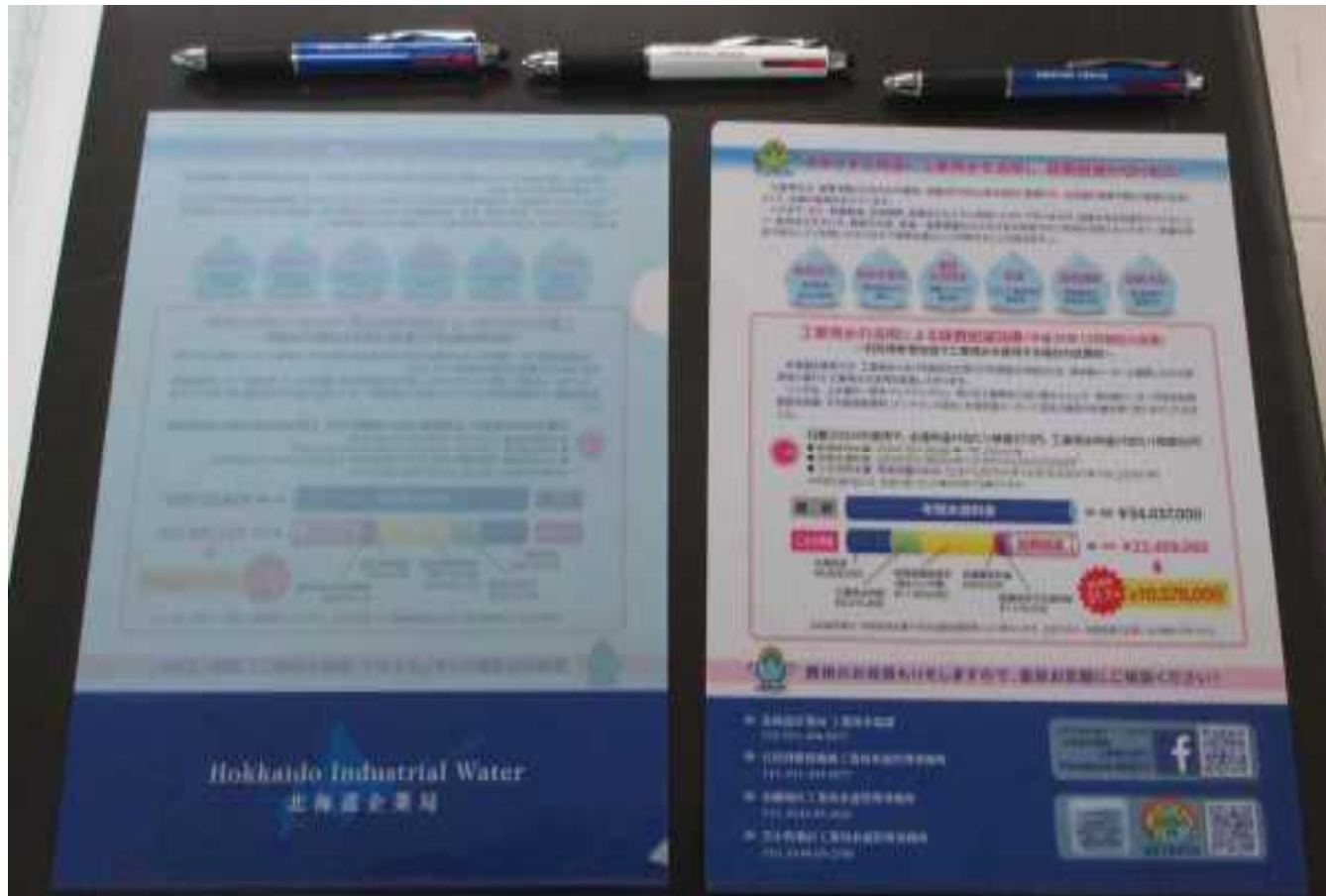
(クリアファイル、ボールペン)