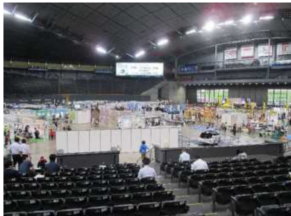
(環境広場さっぽろ2018)