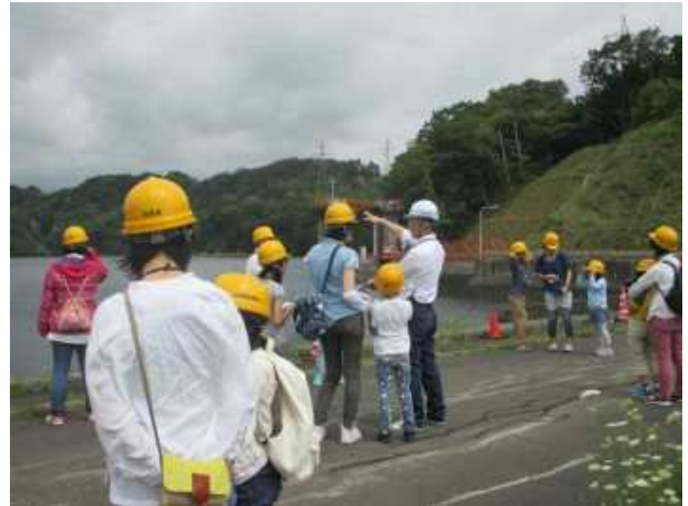
(夏休み親子見学会)