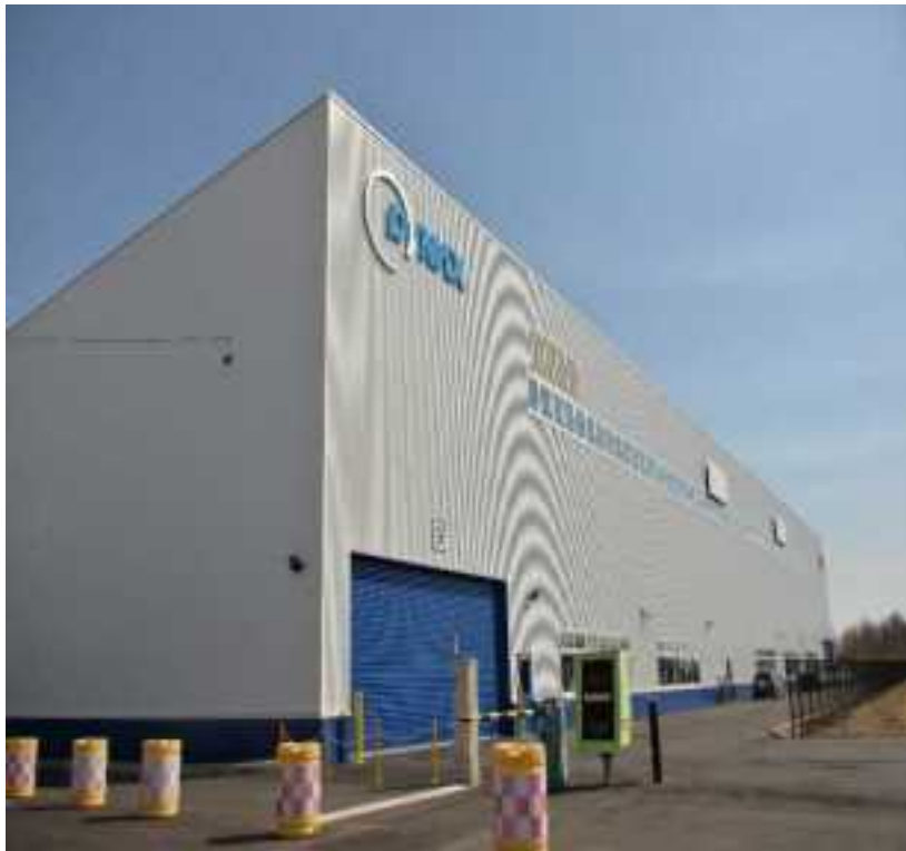
((株)ダイナックス 様)