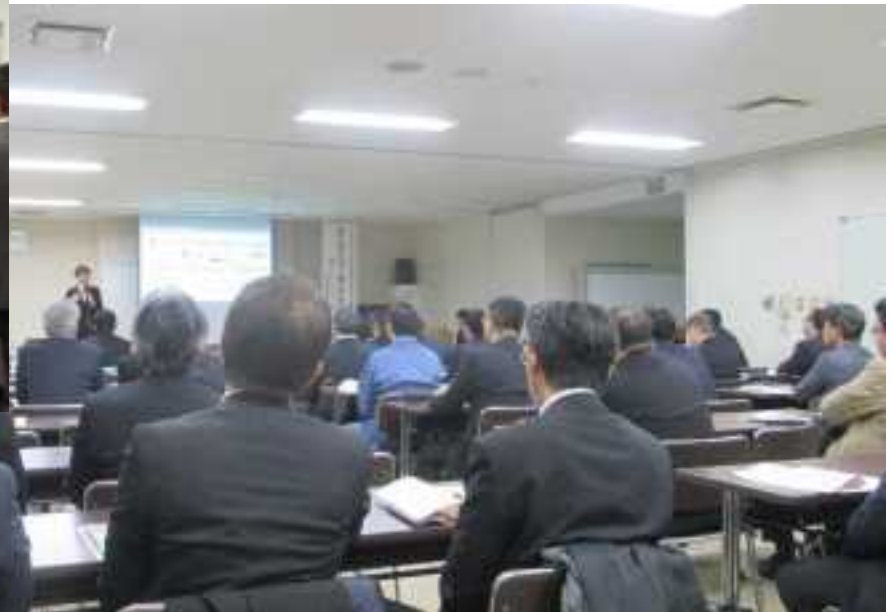
(石狩新港地域立地企業交流会)