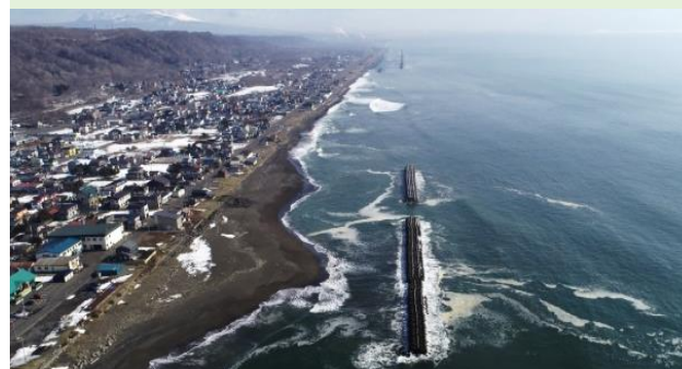
高潮・津波・砂浜の侵食から生命財産を守るため、海岸保全施設の整備を行う。