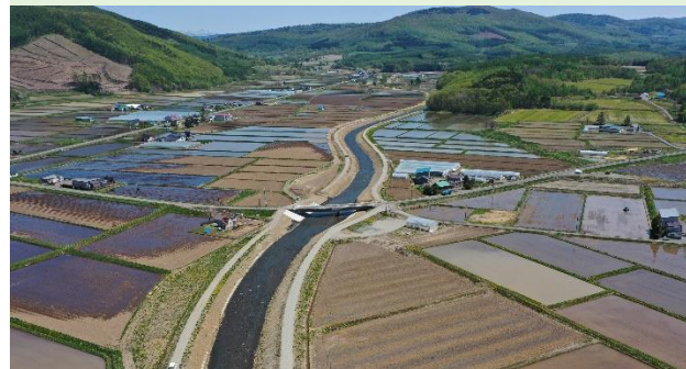
洪水から家屋や農地を守るため、河道掘削や堤防などの整備を行う。