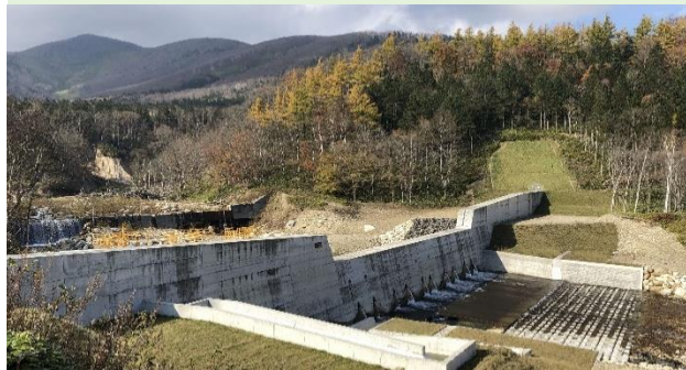
土石流から生命財産を守るため、砂防えん堤などの整備を行う