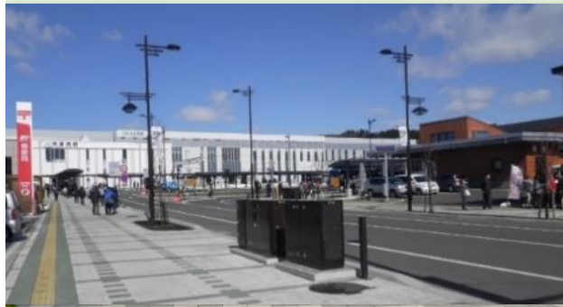
活気あふれるまちをつくるため、街路・公園・下水道などの整備を行う。