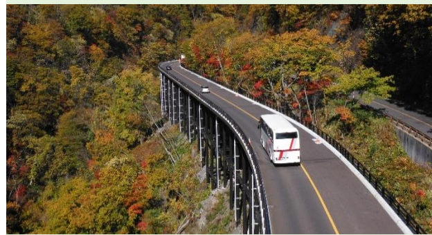
道路網の整備や道路の防災対策、老朽化対策、交通安全対策などの道路整備を行う。