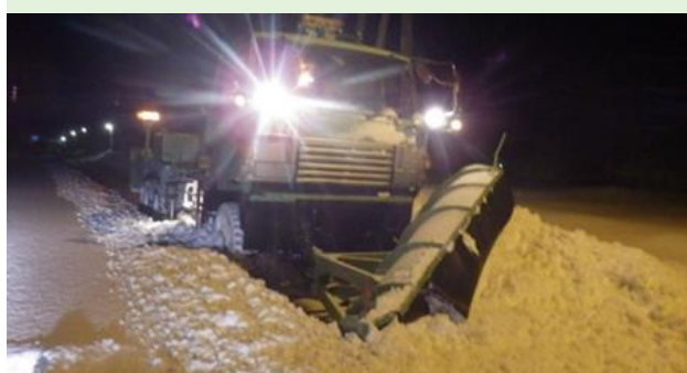
道路・河川等の巡視や点検・補修、道道の除排雪などの維持管理を行う。