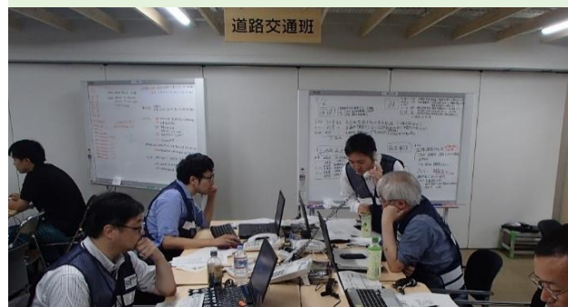
公共土木施設に係る危機管理、防災施設及び防災関連業務を行う。