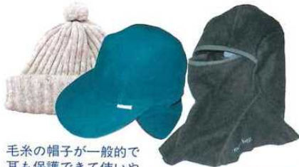
毛糸の帽子が一般的で耳も保護できて使いやすい。降雪時はツバ付き帽子がありがたい