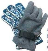
手袋。毛糸は濡れても保温性が高く使いやすい。短時間ならホームセンターの安価なフリース製でもよい