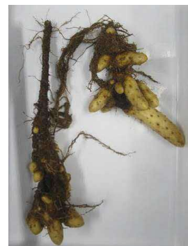
写真5 褐色腐敗病 (崩壊型)