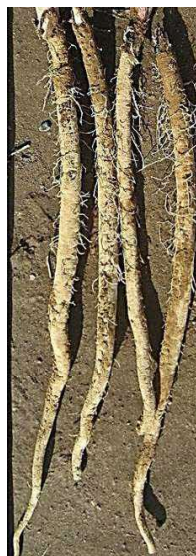
写真6 陥没による形状不良

掘り取り後は、根先のしおれによる品傷みを防ぐため、コンテナに内包資材を充て品質を保持する。