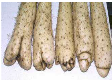
写真2 排水不良による 尻部のコブ

春掘りほ場では、茎葉およびネット、マルチ残さ等で畝上を被覆し、土壌凍結の軽減により腐敗防止を図る。