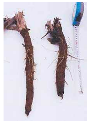
写真7 滞水による 根先の腐敗