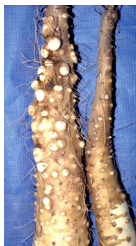
写真3 滞水による 首部の突起