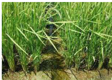
写真1 出穂後の溝切り