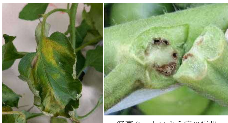
写真2 かいよう病の症状

かいよう病（写真2）は、ハウス内の温度や湿度が高まる条件下で発生しやすく、摘葉や脇芽かき等の作業で2次感染する。発生ほ場では換気をよくし、罹病株の早期抜き取りを徹底し、登録薬剤の散布を行う。また、脇芽かきや収穫作業では、はさみの消毒や手袋の交換など未発生株や未発生ほ場への感染防止対策を講じる。