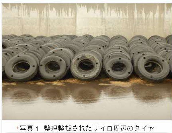
写真1 整理整頓されたサイロ周辺のタイヤ