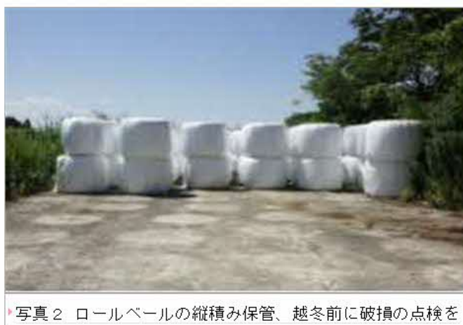
写真2 ロールベールの縦積み保管、越冬前に破損の点検を