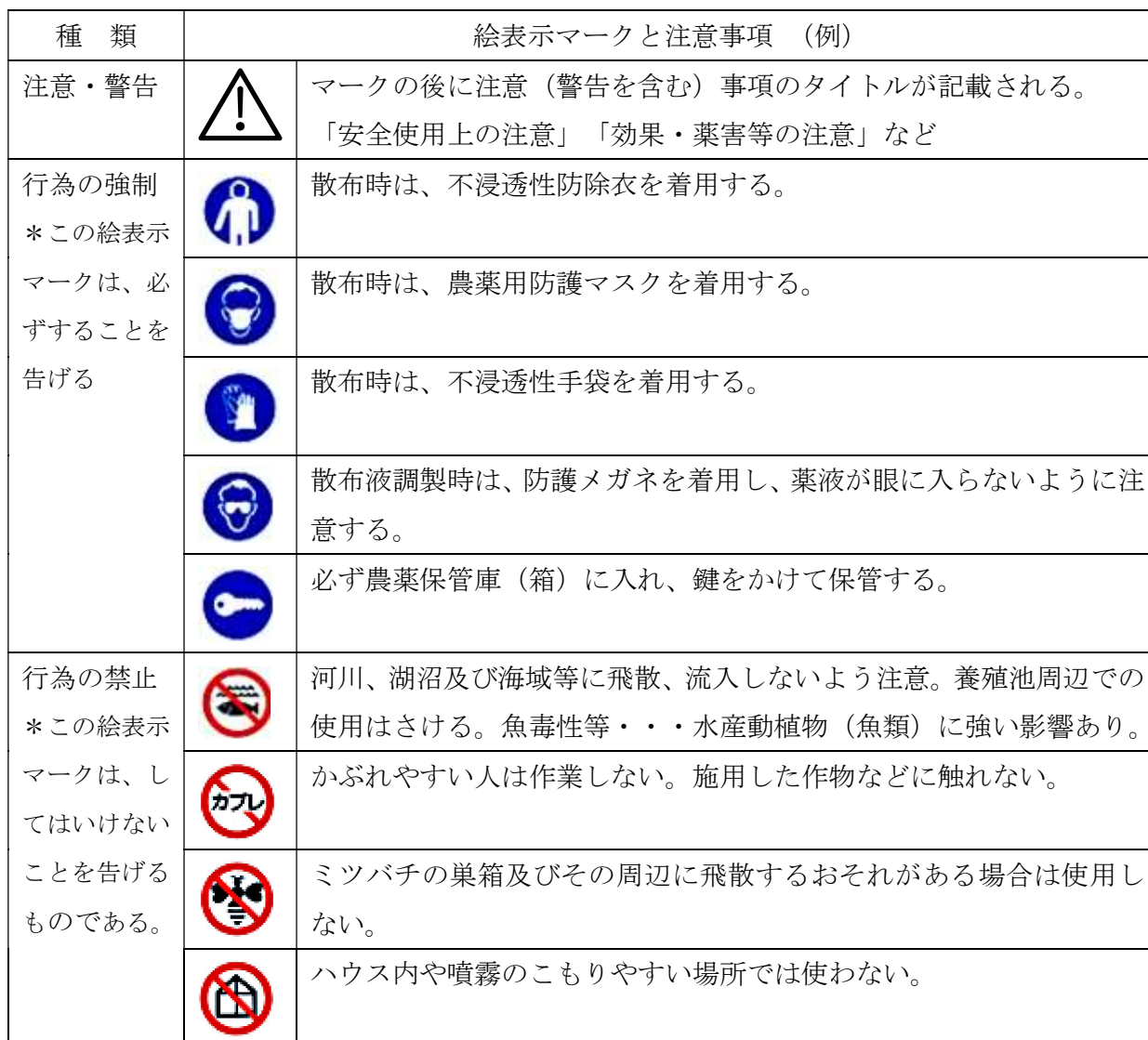
表3 主な注意喚起マークの種類と注意の内容