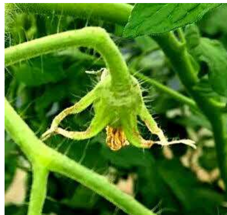
写真6 トマトのがく枯れ

イ 7月はハウス内の高温、強日射に伴い落花や着果不良、がく枯れ（写真6）とカリ欠乏による葉先枯れが増加しや