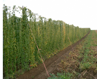
写真2 ロープによる支柱の補強

1株から2本のつるが出ている場合、生育の良いつるを残し、種いもを引き抜かないように株元を押さえながら土の中で芽をかき取る。