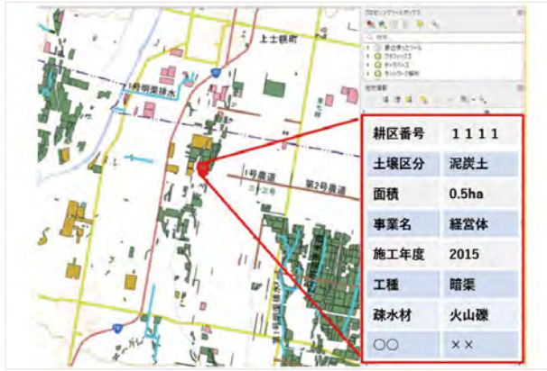
農地や施設の属性情報(土壌区分、面積、施工年度など)を蓄積し、情報提供。