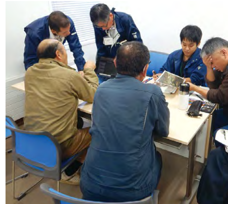
地域の将来の農業ビジョンなどについて話し合う「活

地域農業の課題解決に向けた取組が積極的に展開されるよう、技術的な情報提供や具体策の提案などの支援を行います。