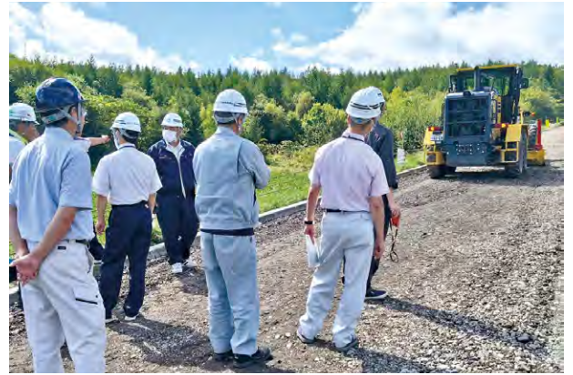
地元関係機関・団体職員も参加できる研修の開催。