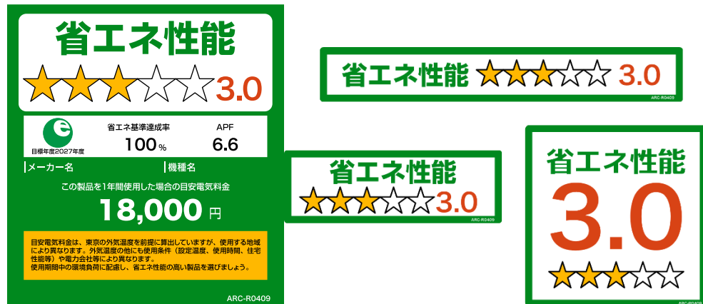
(家庭用エアコンディショナーのイメージ)