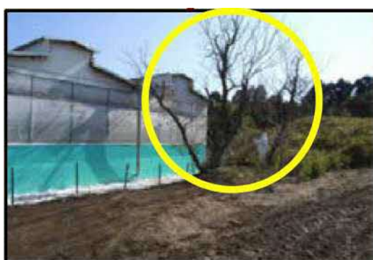
家きん舎周囲の 樹木の剪定