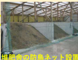
堆肥舎の防鳥ネット設置