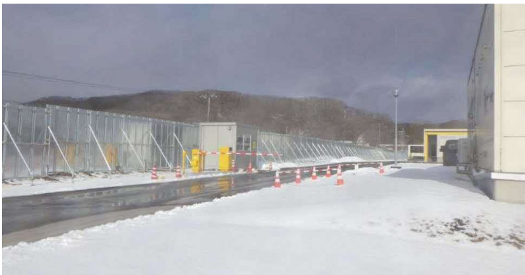
衛生管理区域周囲の壁の設置