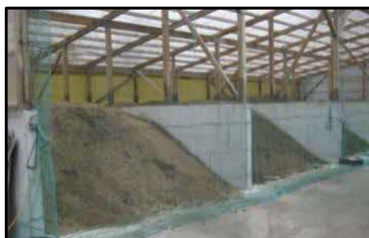
堆肥舎のネット設置