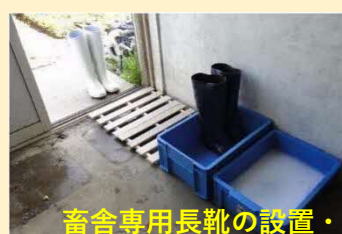
畜舎専用長靴の設置・使用・消毒