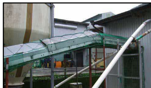
鶏糞搬出口のネット設置

10月から5月までの期間は、毎月、飼養衛生管理者による自己点検を実施してください。