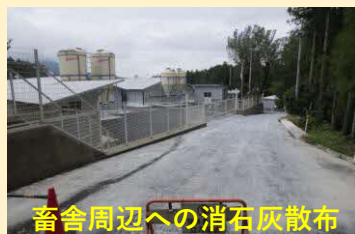
畜舎周辺への消石灰散布