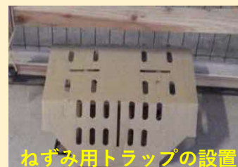
ねずみ用トラップの設置