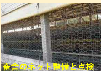
畜舎のネット整備と点検