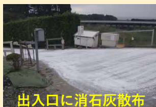
出入口に消石灰散布