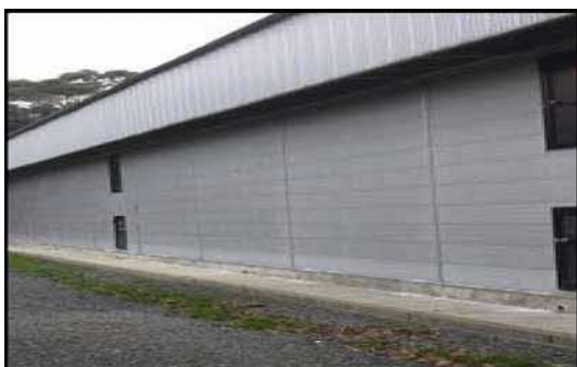
家きん舎周辺の 整理・整頓