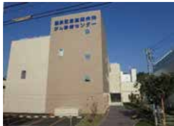
全道的にも先進的な「がん診療センター」