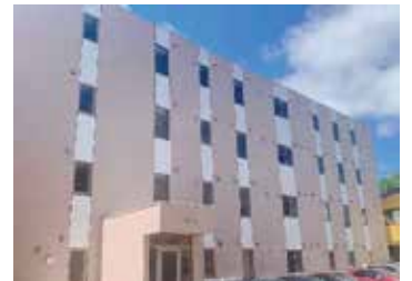
研修医宿舎（病院に隣接）