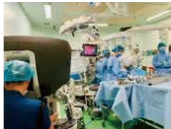
手術支援ロボット「ダヴィンチXi」 手術数は全道有数