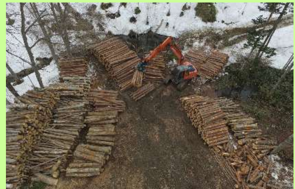
▲山土場でのはい積み作業