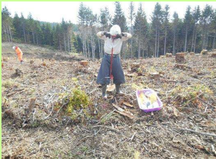
▲コンテナ苗の植付け作業

森林の育成には極めて長い年月を必要とすることから、自然条件等の地域の特性や森林の状態に応じて計画的に森林の整備を行っていくことが重要です。