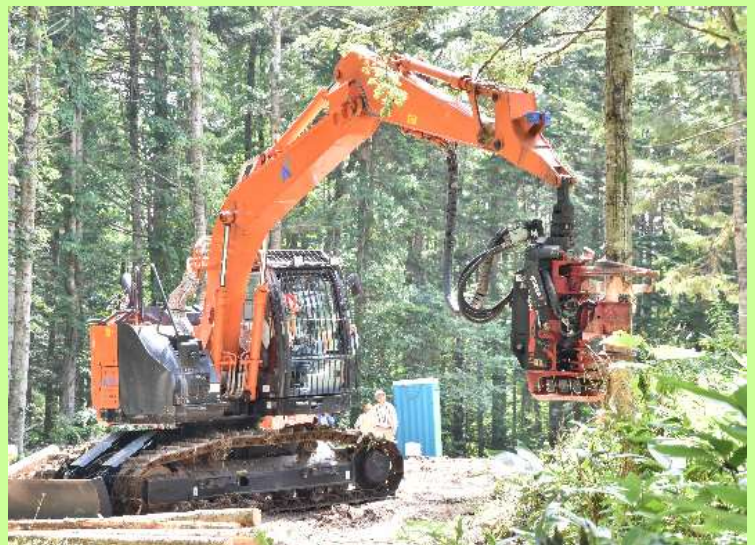
▲高性能林業機械による間伐作業 [北の森づくり専門学院実習風景]