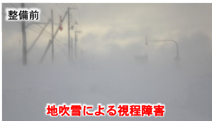
地吹雪による視程障害