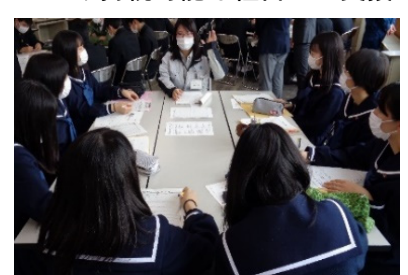
高校生と若手建設産業就業者との意見交換会