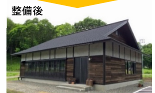
空き家であった老朽化した古民家を移築し、店舗として活用 (厚真町)