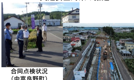
合同点検状況 (中富良野町)