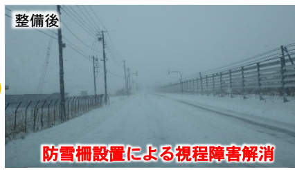
防雪柵設置による視程障害解消