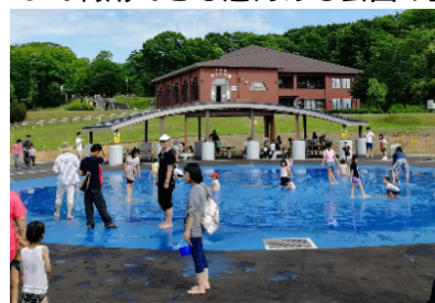
北海道子どもの国 (砂川市)