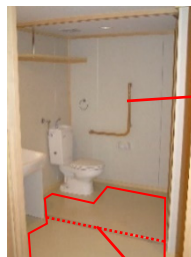
体勢を保持するためのL字型手すりの設置