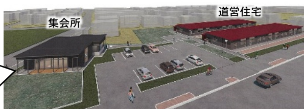
道営住宅の集会所を活用した子育て支援事業 (余市町)