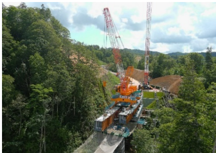
名寄遠別線(遠別町)