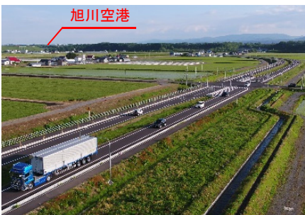
旭川東神楽道路(旭川市、東神楽町)