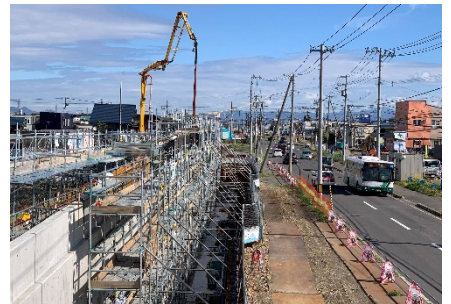
永山東光線(旭川市)