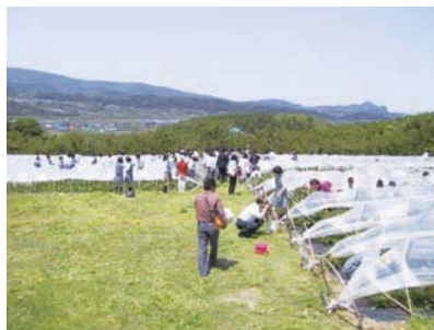
さくらんぼ山観光農園(仁木町)