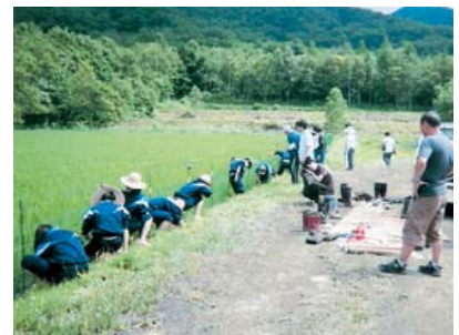
かわさきファーム(蘭越町)