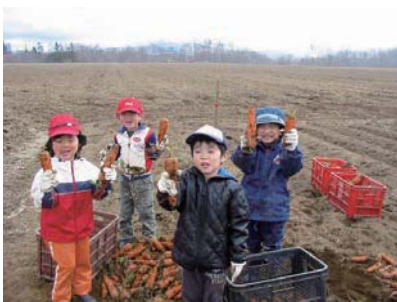
ごとう農園(真狩村)