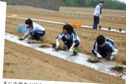
主に中学生が行う、かぼちゃの定植体験