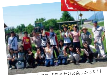
看板の前で記念撮影。「疲れたけど楽しかった！」

野菜を育む大地の香りに包まれながらの農作業。実際の生産の場は生徒たちにとっても驚きが大きかったようです。普段スーパーに並んでいるものとは全く違った「生きている野菜」との出会いが生徒たちの心の奥にしっかりと刻み込まれたと思います。同時に生産者の方々とのふれあいは、普段口に入っている食べ物人がによって作られているという感覚を養ってくれたと強く感じました。