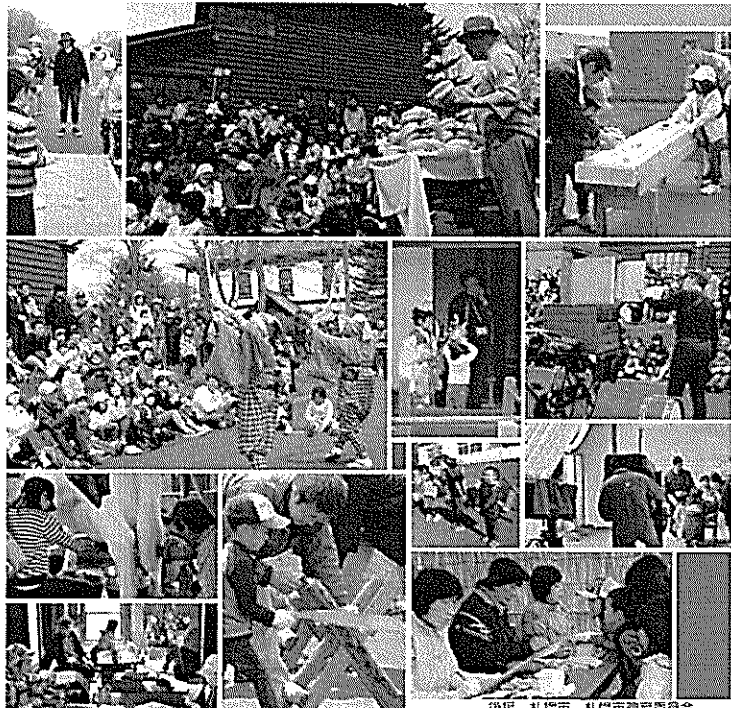
後援 札幌市、札幌市教育委員会