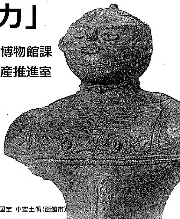
国宝 中空土偶(函館市)