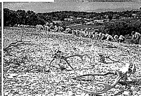
北黄金貝塚(伊達市)