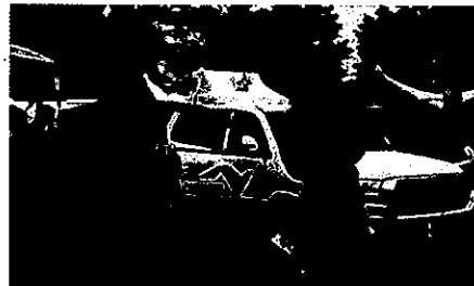
【高速道路パトロールカーも展示します】 (一部会場のみ)