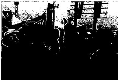
【ご当地キャラも大集合】