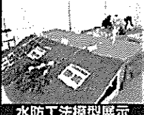
水防工法模型展示