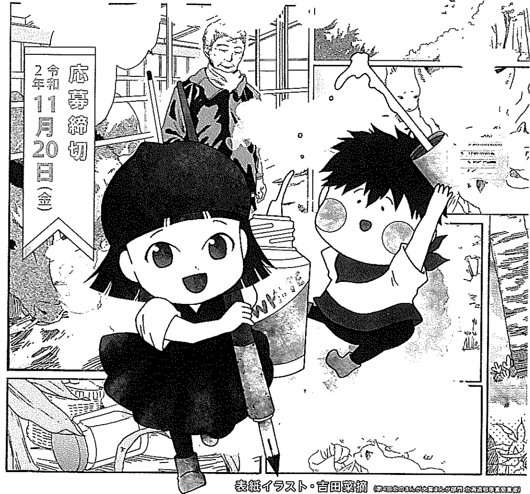
表紙イラスト・吉田菜摘 (第4回全体的まんが部門応募者による)