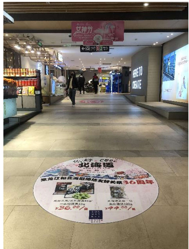
B1食品販売フロア外 床ステッカー 22箇所