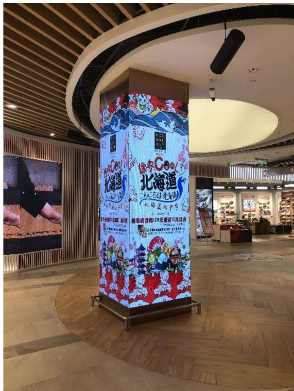
B1駐車場出入口 LEDディスプレイによる告知