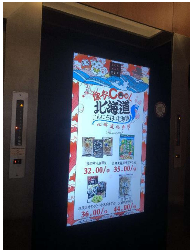
エレベーター入口48箇所 エレベーター内16箇所 LEDディスプレイによる告知（イベント商品/食絶景北海道/観光/アイヌ・縄文文化）