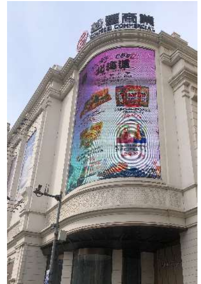
店舗外壁面でのディスプレイによる告知 3箇所